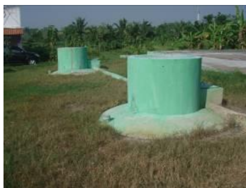
Gambar 1 Anaerobic Digester