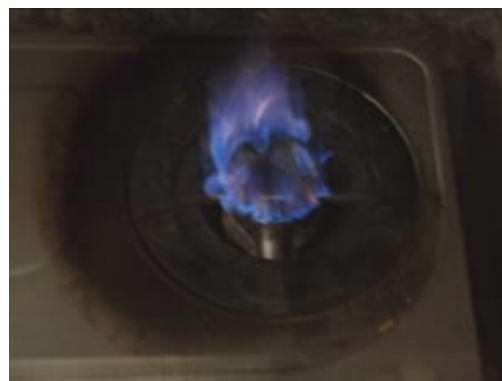
Gambar 2. Kompor Dengan Bahan Bakar Metana

Desain kedua unit pengolahan limbah ini adalah mampu mengolah sekitar 225 m 3 limbah setiap hari, dengan hasil analisa kualitas air IPAL tanggal 20 Agustus 2010 sesuai tabel 7.