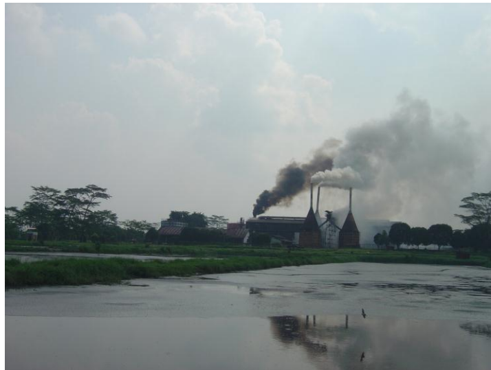
Gbr. 2. Kolam pengolahan limbah cair di salah satu PKS milik PTPN VI

Pada PKS yang memanfaatkan limbah cair untuk land application, karena nilai BOD limbah cair harus di bawah 5000 mg/L, maka beberapa kolam aerobik menjadi tidak dipakai. Limbah cair yang sebelumnya dialirkan melalui 8-9 kolam pengolahan limbah cair, menjadi hanya dialirkan ke 2-4 kolam limbah cair. Perubahan ini untuk menjaga agar zat organik yang tersisa masih dapat dimanfaatkan sebagai bahan nutrisi dan untuk menjaga nilai BOD agar mendekati nilai ambang batas (5000 mg/L). Lumpur/ sludge dari kolam pengolahan limbah cair biasanya dipakai untuk pupuk.