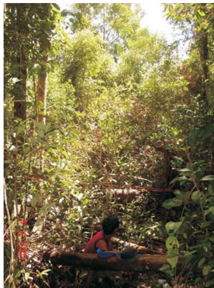
Plot di hutan rawa gambut, Kalamangan