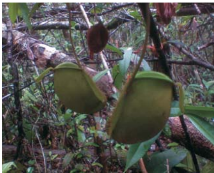
Nepenthes ampullaria hijau polos