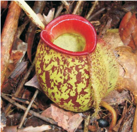
Nepenthes ampullaria bercak coklat bibir merah