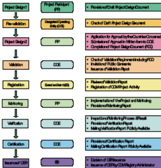
Gambar 4. Proses administrasi CDM

Tiap langkah yang dilakukan dalam proses administrasi CDM, dapat memakan waktu lebih dari satu tahun. Intinya perlu dilakukan klarifikasi terhadap pelaksanaan proyek CDM apakah pengurangan CO 2 terjadi dengan pasti, dan klarifikasi methodology perhitungan bisa dipertanggungjawabkan.