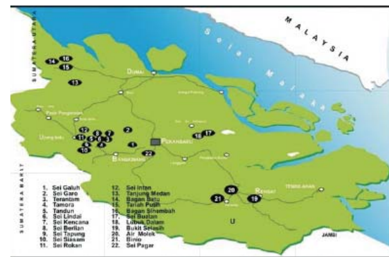
Gambar 1. Lokasi Pabrik Kelapa Sawit

Lokasi pabrik kelapa sawit dan pekebunannya semuanya tersebar di Propinsi Riau, seperti ditunjukkan di Gambar 1.