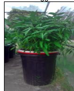
Gambar 3. Pertumbuhan tanaman kangkung dan ikan lele 5 minggu setelah tanam