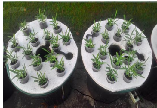
Gambar 2. Kangkung akuaponik 1 minggu setelah tanam

Pertumbuhan tanaman adalah proses bertambahnya ukuran dari suatu organisme mencerminkan bertambahnya protoplasma. Penambahan ini disebabkan oleh bertambahnya ukuran organ tanaman seperti tinggi tanaman sebagai akibat dari metabolisme tanaman yang dipengaruhi oleh faktor lingkungannya di daerah penanaman seperti air, sinar matahari dan nutrisi (6) . Sebagai gambaran pertumbuhan tanaman kangkung, dapat dilihat pada Gambar 2 dan Gambar 3 berikut ini.